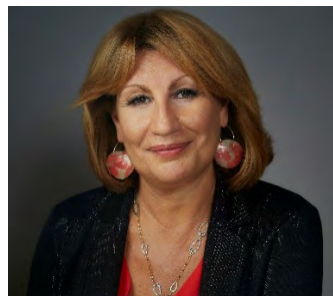
Emilia Saiz Carracedo Secretaria general, Ciudades y Gobiernos Locales

En última instancia, la responsabilidad de garantizar que todas las poblaciones tengan un acceso de calidad a los servicios públicos locales recae en el Estado y, en particular, en los gobiernos locales, metropolitanos y regionales. A pesar del papel protagonista que han desempeñado dichos gobiernos locales, metropolitanos y regionales para hacer frente a la pandemia de COVID-19, las estrategias de recuperación y los marcos nacionales de prestación de servicios siguen sin tener en cuenta de forma sistemática las inversiones necesarias para garantizar y reforzar la prestación de servicios públicos locales. La cooperación entre los gobiernos nacionales, locales, metropolitanos y regionales, así como las alianzas con los actores locales, son fundamentales para cumplir con dicha responsabilidad. A medida que avanzamos hacia el futuro, el refuerzo de nuestros sistemas de servicios públicos locales definirá la forma en que las ciudades y los territorios podrán mitigar los impactos negativos de las emergencias complejas en sus poblaciones. Por lo tanto, queda claro que ha llegado el momento de unir fuerzas y hacer que estos sistemas sean lo más sólidos posible.